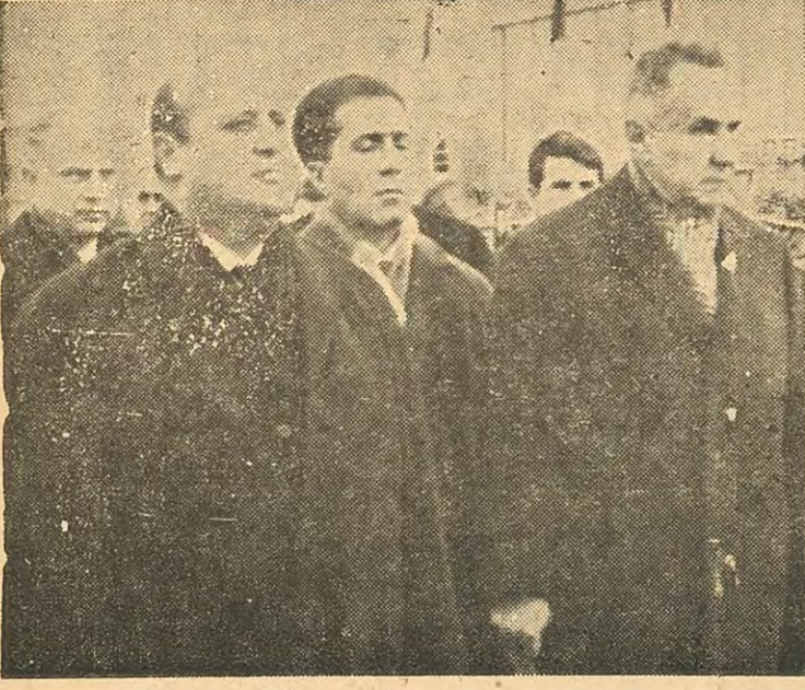
Başbakan Demirel ve Kossig'in