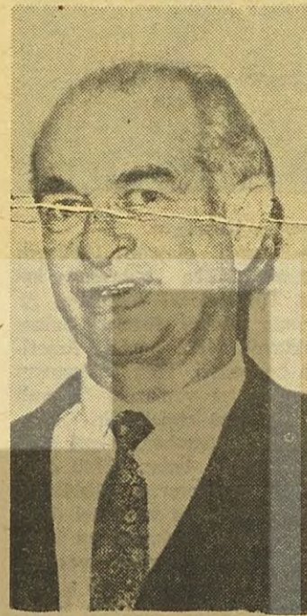
Prof. Linus Pauling

Benim memleketim, Vietnam'da biyolojik ve şimik silâhlar kullanılmaktadır. Bu konuda da kamu oyu aldatılmaktadır: Deniliyor ki, bu gazlar zehirli değildir. Geçici bir felç ve basit bir kusma yaparlar. Aslında gaz, çocuklar, hastalar ve ihtiyarlar üzerinde korkunç biyolojik etkiler doğurmaktadır. Hâlen gaz kullanılması yüzünden ölen sivil